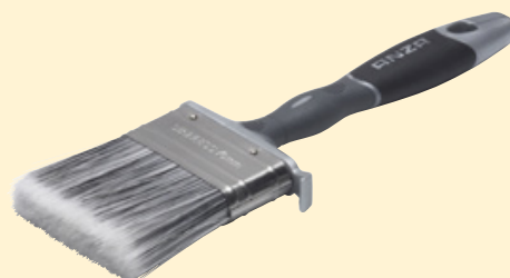
Anza Platinum Flat pintsel