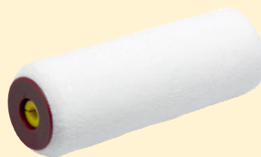
Anza Elite Felt roll

Värvimisel kasuta viltrulli (karva pikkus 5-7 mm) ja pintslit.